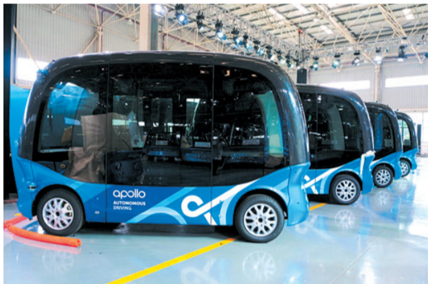
Nedávno byl vyroben 100. autonomní minibus Apollo od Baidu

Možná ještě dříve, než dojde k masovému rozšíření robotických osobních vozidel, najdou si tyto technologie cestu do hromadné městské dopravy. V Tišnově bychom městskou linku rozhodně uvítali, uvažuje o ní i zmíněný Generel dopravy. Vše je však hlavně otázkou ekonomické výhodnosti, držet vlastní dopravní podnik nezvládneme a dohody s dopravci provozujícími meziměstské linky mají své limity. Pokud bychom měli k dispozici elektrický minibus, který jezdí sám bez řidiče rychlostí kolem 40 km/h na pevně dané trase s pevnými zastávkami, tj. pouze s náklady na elektřinu a údržbu vozu, už je to ekonomicky myslitelné. Začne na nádraží, vezme to přes náměstí kolem školy na sídlišti pod Květnicí až k penzionu, pak přes novou zástavbu kolem nemocnice na sídlišti pod Klucaninou a následně po Brněnské a kolem Humpolky zpět k nádraží. A hned po dojezdu si může trasu rovnou zopakovat, není třeba žádných povinných pauz. Science fiction? Nikoliv. Nedávno byl v Baidu (čínská obdoba Google) vyroben 100. autonomní sériový minibus Apollo určený právě pro takové použití. Jak dlouho může trvat, než se dostane podobná technologie i k nám?